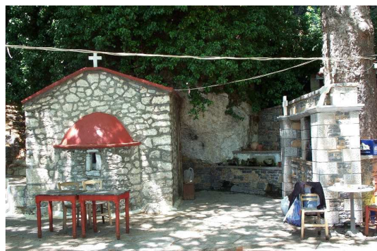
"Η πηγή της Σαρακίνας" Η αυλή της ταβέρνας και το καμπαναριό της εκκλησίας. Το παρεκκλήσι στην αυλή της ταβέρνας και η βρύση.

Στην είσοδο του Χριστού, στα δεξιά σας, υπάρχει μια πινακίδα που σας δείχνει το δρόμο προς Σελεκάνο, N 35° 05.31.95, E 25° 32.42.83 (9,4 χλμ.). Τα πρώτα χιλιόμετρα της διαδρομής είναι στρωμένα με τσιμέντο (βλέπε φωτο.), το υπόλοιπο είναι χωματόδρομος με χαλίκι, που διακόπτονται περιστασιακά από μικρά ρυάκια. Ωστόσο, η απόσταση που διανύεται είναι πολύ εύκολη ακόμα και με ένα κανονικό αυτοκίνητο.