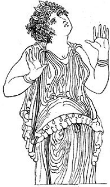
Γαία, λεπτομέρεια από την Γιγαντομαχία: αττική-ερυθρόμορφη κύλικα, 410-400 π.Χ.

Το Χάος ήταν μόνο του, γύρω του επικρατούσε ατελείωτο κενό και βαθύ σκοτάδι. Μετά από χιλιετίες που υπέφερε από μοναξιά δημιούργησε (ή γέννησε) την Γαία . Ακολούθησαν ο Τάρταρος* (Κάτω Κόσμος), ο Ερεβος (Θεός του σκότους του Κάτω Κόσμου), η Νύξ (Θεά του σκότους της νύχτας) και ο Έρως (Θεός του έρωτα). (* εδώ έχουμε το πρώτο “πρόβλημα”, καθώς κατά μία άλλη εκδοχή ο Τάρταρος δεν είναι αδελφός της Γαίας , αλλά ένας από τους γιους της!)