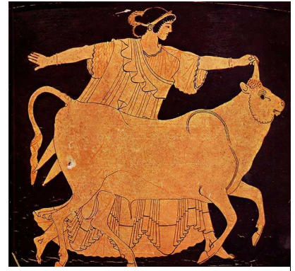
Ευρώπη και Ταύρος, Αττικός ερυθρόμορφος κρατήρας, περ. 490 π.Χ. Tarquinia, Museo Nazionale Tarquiniese, Ιταλία

Η Ευρώπη, μέσα στην εγκατάλειψή της, του έδωσε το χέρι σαν σημάδι της συγκατάθεσής της, και έτσι ο στόχος του Δία επετεύχθη. Και αυτός εξαφανίστηκε όπως ήρθε.”