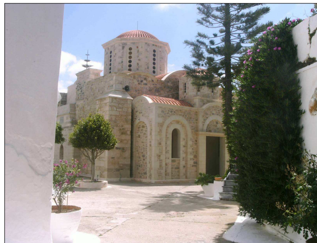
Η ανακαινισμένη εκκλησία στην εσωτερική αυλή της Μονής