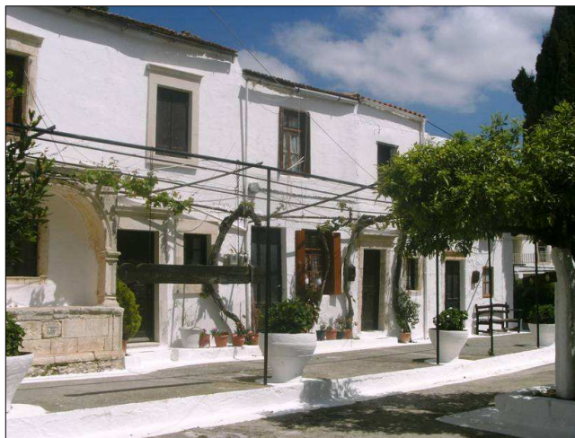
Αυλή της Μονής με κελιά μοναχών και παλιό συντριβάνι

Το 1866 οι Κρητικοί επαναστάτησαν ξανά και η Μονή έγινε το αρχηγείο του σημαντικού ήρωα της επανάστασης της Κρήτης, Αντώνιου Τριφυτού . Το 1894 ξαναχτίστηκε η εκκλησία της Μονής και το 1898 τελείωσε η τουρκική κυριαρχία. Τα τελευταία χρόνια, όπου ο μοναχισμός έχει πάρει μία κατ'εξοχήν πνευματική μορφή, η Μονή έγινε εκ νέου ένα κέντρο για την παιδεία και τον πολιτισμό.