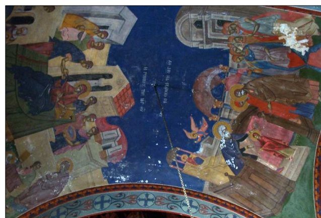
Νέες τοιχογραφίες στον εκκλησιαστικό θόλο