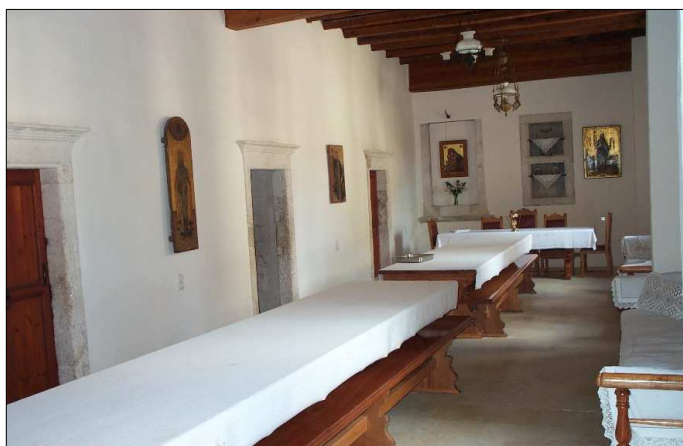
Αίθουσα συγκέντρωσης/τραπεζαρία των μοναχών

Μετάφραση από τα γερμανικά: Μαρία Νικηφόρου