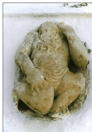
Ανάγλυφο. Λάφυρο στην αυλή της Μονής

Μετάφραση από τα γερμανικά: Μαρία Νικηφόρου