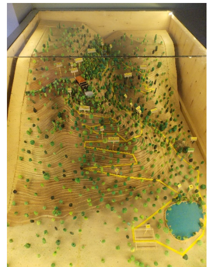
3-dimensionales Model der Gartenanlage

Am Garten angekommen finden sie einen kleinen Parkplatz vor einem recht großen Restaurant mit einer sehr schönen Terrasse von der aus sie einen Teil der Anlage überblicken können. Der Eintritt zum Garten beträgt 6,00 Euro zudem sie noch eine Flasche Wasser erhalten (August 2017). Ein Schild, in mehreren Sprachen gehalten, weist darauf hin, dass der Weg durch den Garten teilweise sehr steil ist und sie ungefähr 2,5 Stunden für den großen Rundweg benötigen.