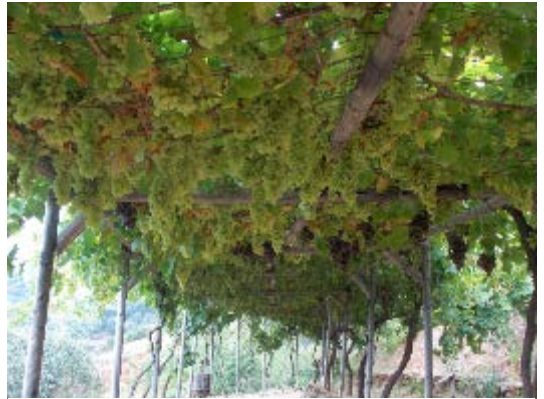
Vitis vinifera (Wein)