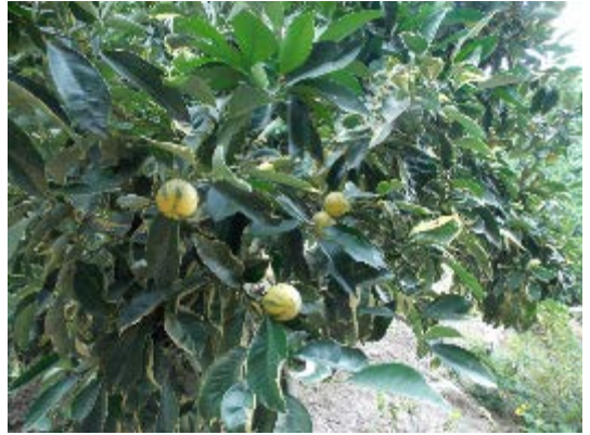
Orange Variegated (Ornamental Orange)