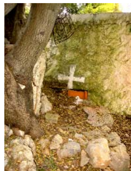
Die obere Bildreihe zeigt das "Eingangstor" zum Kapellenbereich und eine Totalansicht der Kapelle. Die untere Bildreihe die Ikonostase (Altarbereich) und einen Seitenaltar. Die Abb. re. zeigt ein altes Grab außerhalb des Kapellenplateaus an einer Begrenzungsmauer.