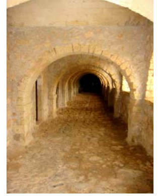
Die Abb. zeigen (v. li. n. re.): die linke Seite neben der Kirche mit Arsenalräumen, Küche, Refektorium und Mönchzellen; die Frontansicht der Kirche im Innenhof und einen Blick in einen Kreuzgang, hier links des Eingangs, die derzeit renoviert werden.