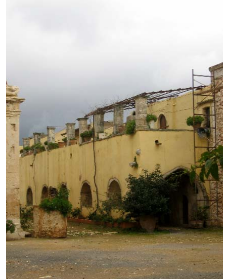
Die Abb. zeigen das Innere der Kirche mit Blick auf den Altarraum und eine Christi-Großikone (auf Holz gemalt, umrahmt mit vergoldeten Schnitzereien). Die Abb. rechts zeigt die rechte Seite neben der Kirche mit Lageräumen. Auf dieser Seite ist auch ein kleines Museum eingerichtet.

Fotos: (1) H. Eikamp / (6) U. Kluge (20.12.2005)